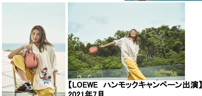
【LOEWE ハンモックキャンペーン出演】 2021年7月