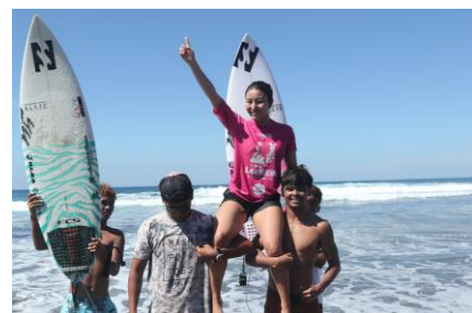
20230126 WSL QS3000 「La Union International Pro」優勝 🏆 !