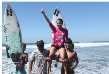
20230126 WSL QS3000 「La Union International Pro」優勝 🏆 !