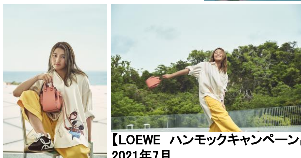
【LOEWE ハンモックキャンペーン出演】 2021年7月